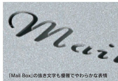
「Mail Box」の抜き文字も優雅でやわらかな表情