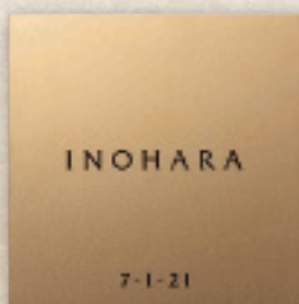
TIG-2 チタンシャンパンゴールド 32,000円(税抜) ※ ● 150W×150H×2T(mm) 約200g ● ドライエッチング 黒 ● 書体: フリッツ