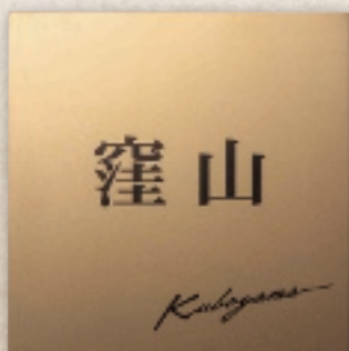
TIG-1 チタンシャンパンゴールド 35,000円(税抜) ● 180W×180H×2T(mm) 約290g ● ドライエッチング 黒 ● 書体: 明朝体&ティーサイン