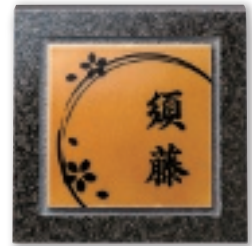
UBS-141 七宝・特金(とつきん)(黒文字) 45,000円(税抜)