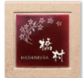
UBS-139 七宝・赤透(あかさけ)(白文字&素彫) 57,000円(税抜)