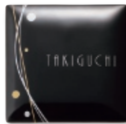
AUT-513 うるわし(ツムギ・墨)(素彫文字)