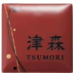
AUT-511 うるわし(ツムギ・朱)(黒文字)