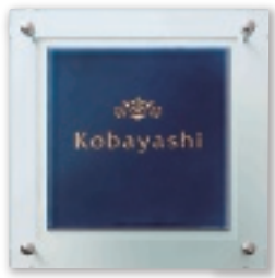
UBS-140 七宝・水紺(みずこん)(金箔文字) 51,000円(税抜)