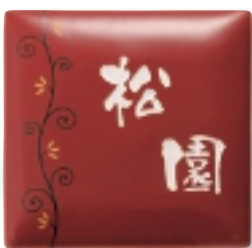
AUK-515 うるわし(カラクサ・朱)(素彫文字)