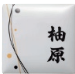
AUT-512 うるわし(ツムギ・白)(黒文字)