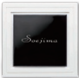
UBS-136 七宝・墨透(すみすけ)(白文字) 57,000円(税抜)