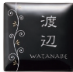
AUK-517 うるわし(カラクサ・墨)(素彫文字)