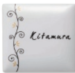
AUK-516 うるわし(カラクサ・白)(黒文字)