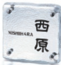
GF1-515 せせらぎ(黒文字) 34,000円(税抜)