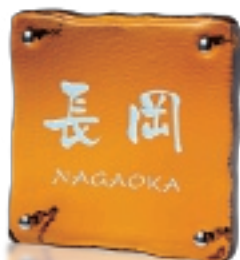
GF7-812 ほおずき(白文字) 37,000円(税抜)