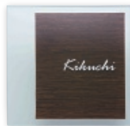
GPA-2 合わせガラス(ウェンジ)