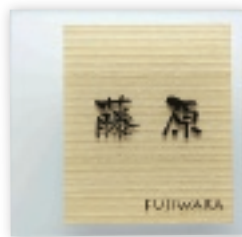
GPA-5 合わせガラス(ホワイトアッシュ)