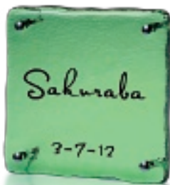
GF3-811 ささのは(黒文字) 37,000円(税抜)