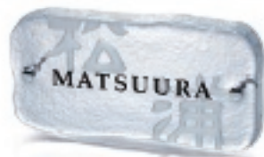
GF1-318 せせらぎ(黒文字&素彫) 39,000円(税抜)