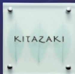
GPA-1 合わせガラス(リーフ)