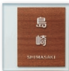
GPA-7 合わせガラス(サベリ)