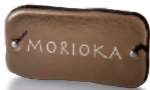
GF5-321 くぬぎ(白文字) 36,000円(税抜)