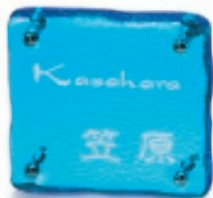
GF8-501 あさがお(白文字) 34,000円(税抜)