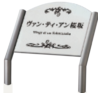
AZ-128 クリスタル口(ミラノホワイト)