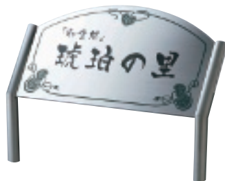
SZ-304 ステンレス板ドライエッチング