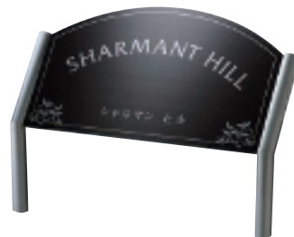
SZ-308 ステンレスブラック板ドライエッチング