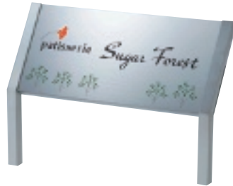
SZ-307 ステンレスドライエッチング