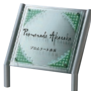
GZ-201 クリアーガラス&ステンレス