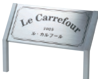
SZ-303 ステンレスドライエッチング