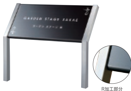
SZ-306 ステンレスブラックドライエッチング