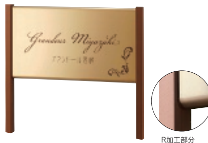
SZ-1003 ステンレスゴールドドライエッチング