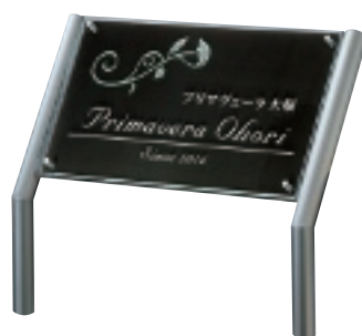
GZ-203 クリアガラス&ステンレスブラック