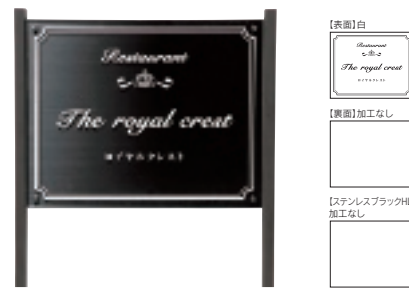
WZ-102 ガラス調アクリル&ステンレスブラック