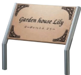
AZ-130 クリスタル口(ローマンページユ)